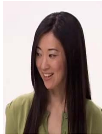
りゅうがくせい センターのひと