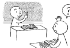
先生に ききます to ask the teacher