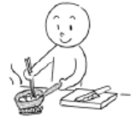
りょうりを します (to) fix a meal