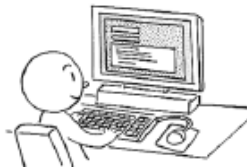
メールを かきます (to) write e-mail