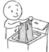
せんたくを します (to) do laundry