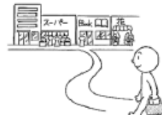
かいものに いきます (to) go shopping