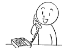
でんわを します/かけます (to) make a phone call