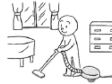
そうじを します (to) clean /dust a room