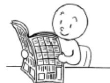
しんぶんを よみます (to) read a newspaper