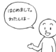
日本語で はなします (to) talk in Japanese