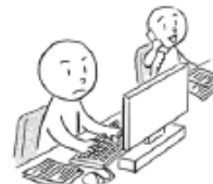
しごとを します (to) work