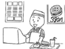
アルバイトを します (to) have a part-time job