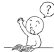
しつもんします (to) ask a question