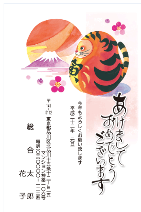
年賀状 (ねんがじょう)